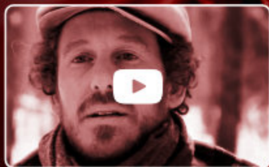
JUNE IN SIBERIA Clip