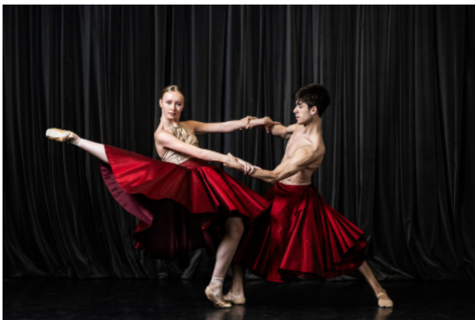
Requiem for a rose (Anabelle Lopez Ochoa), Junior Ballet

01 : Santander, Espagne (Palacio de los Festivales)