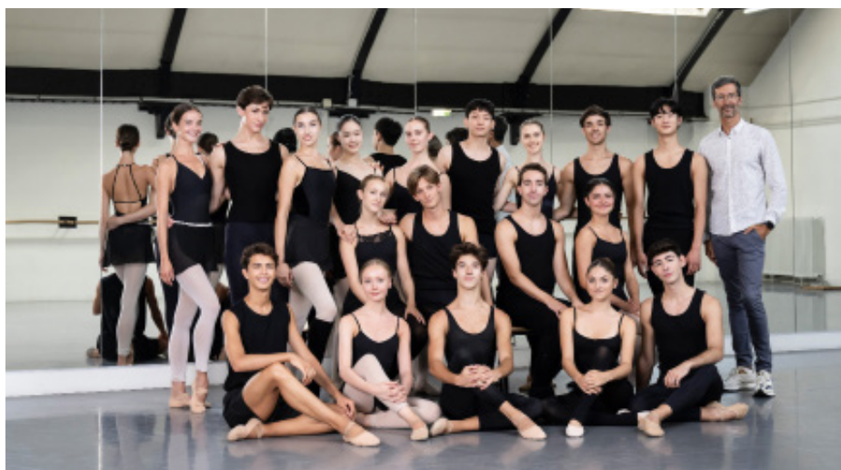
Les 18 danseuses et danseurs du Junior Ballet avec José Martinez, 29 août 2024