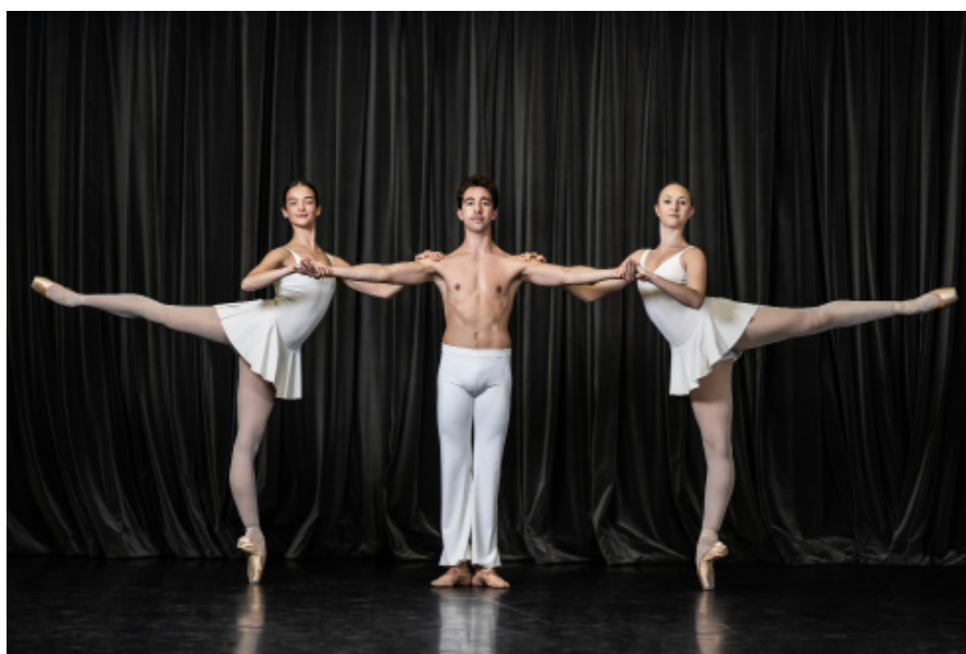
Cantate 51 (Maurice Béjart), Junior Ballet

+335 45 94 75 95 contact@deltadanse.com www.deltadanse.com