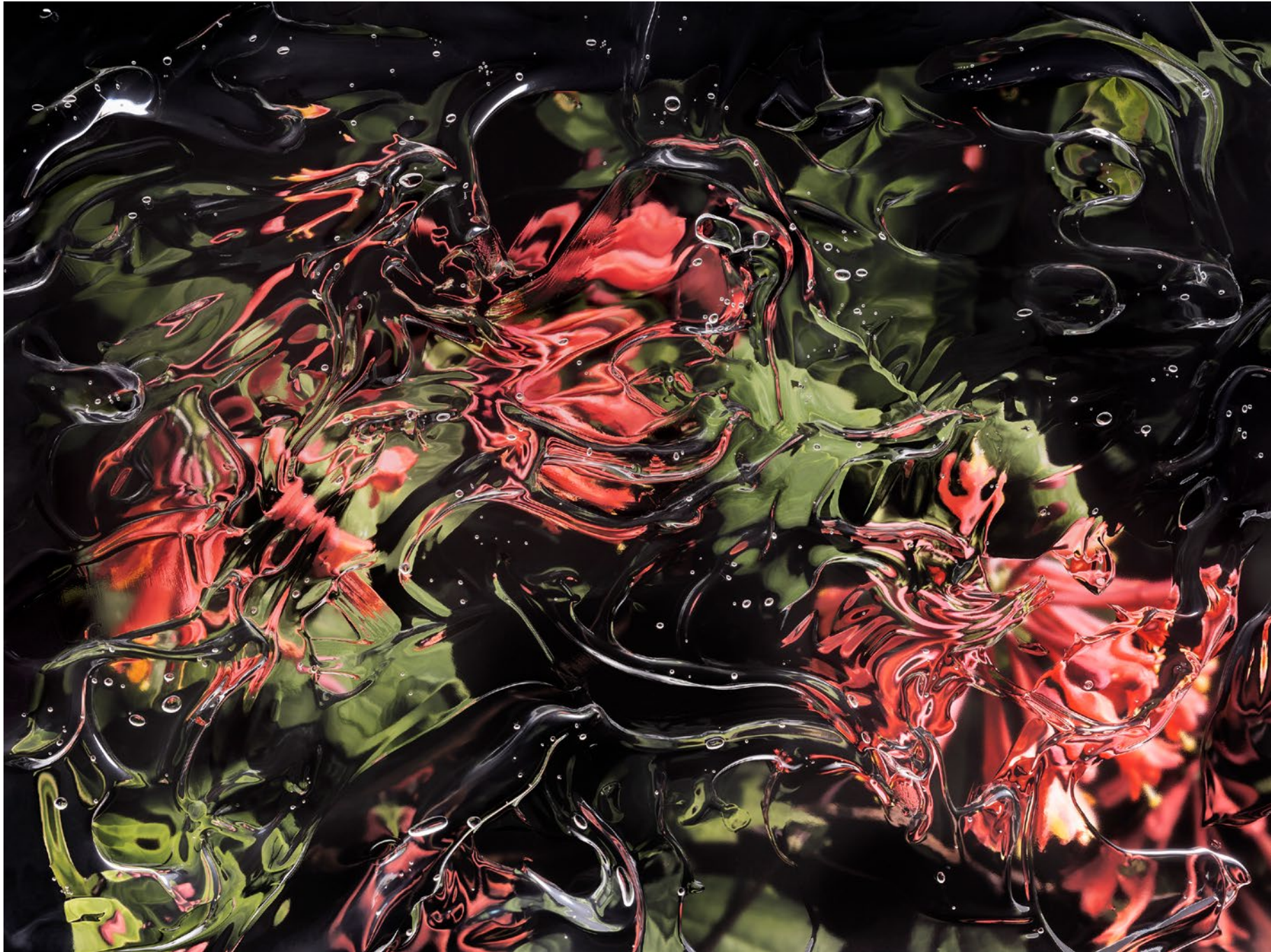
CAPRIFOLIACEAE LONICERA SEMPERVIREN