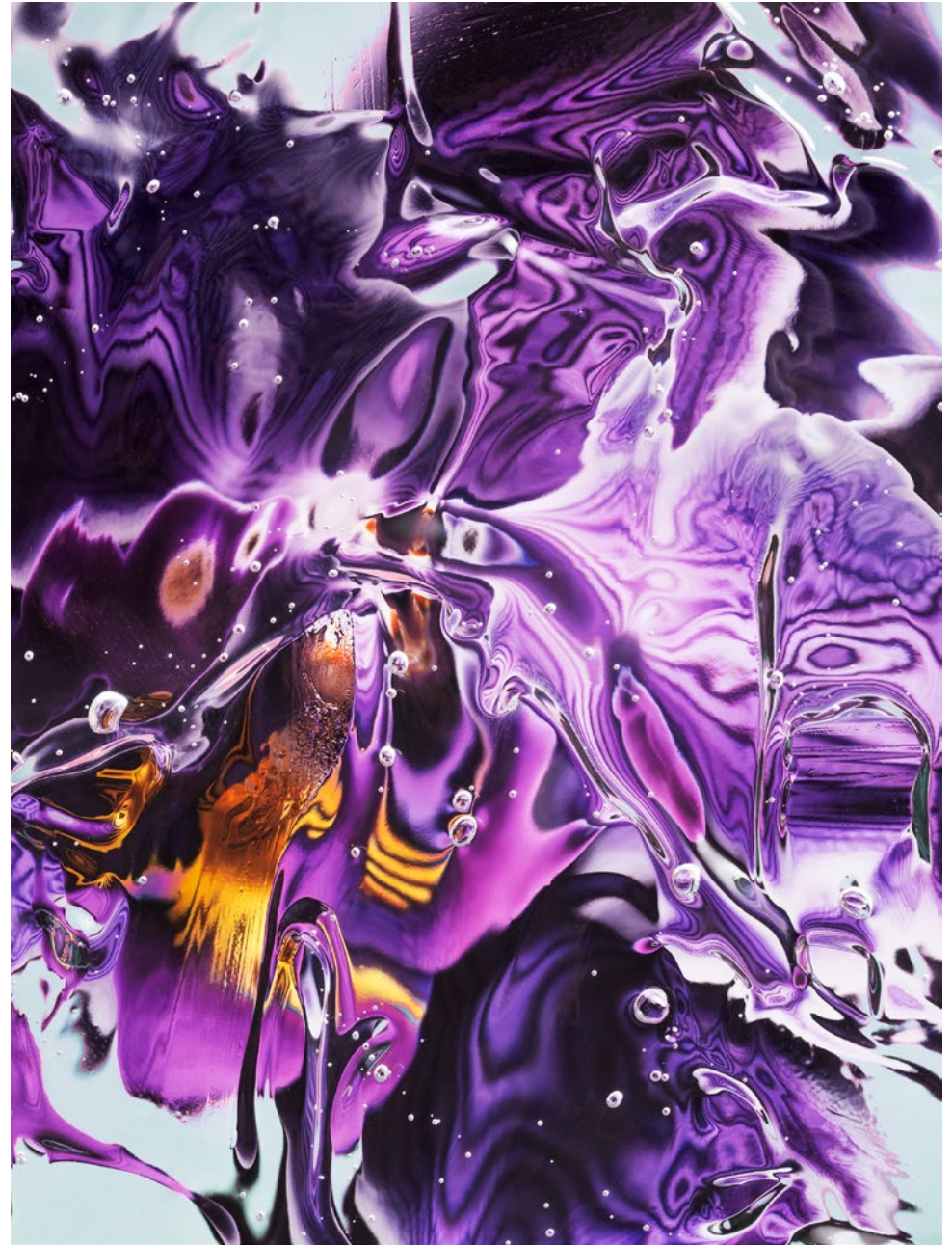
ORCHIDACEAE PHALAENOPSIS IV