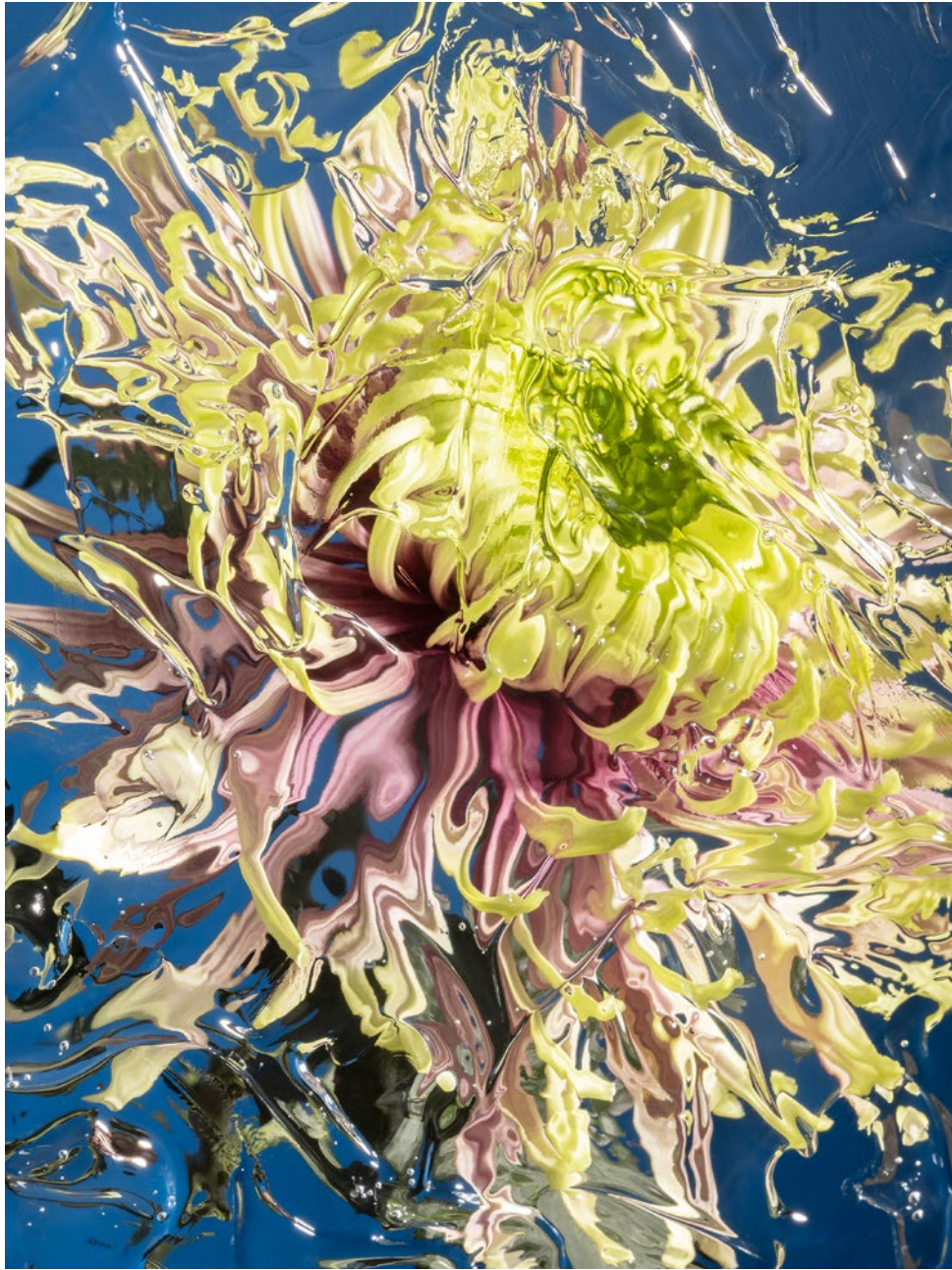
ASTERACEAE CHRYSANTHEMUM BALTHAZAR