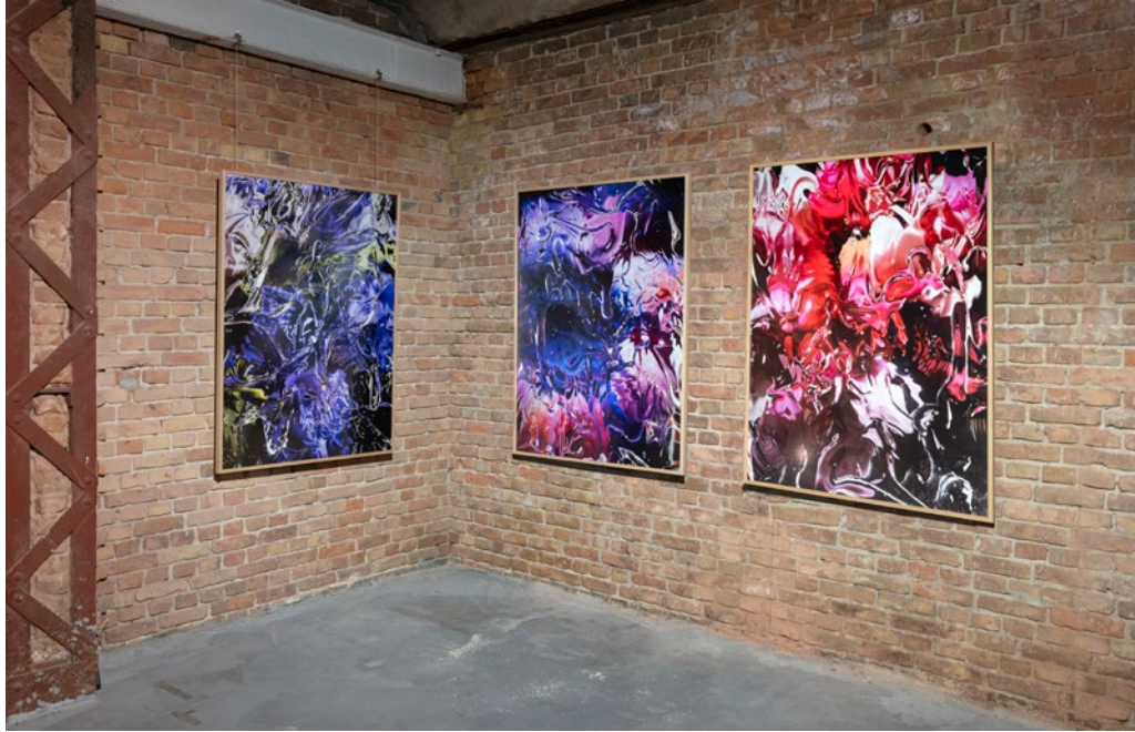
EXPOSITION À LA KUHLSHAUS DE BERLIN, MAI 2025